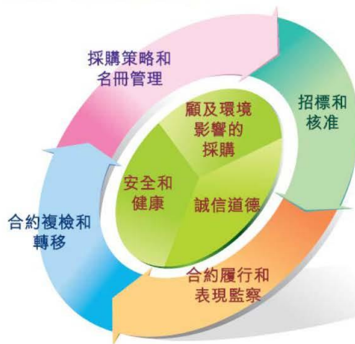
採購周期和採購管理