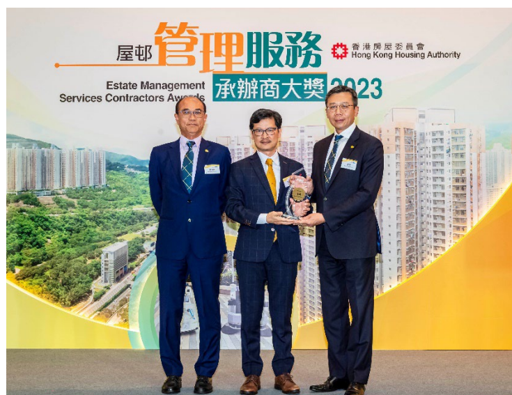
房屋署副署長（屋邨管理）楊耀輝（中）與「最佳物業服務公司（公共屋邨）」金獎承辦商代表合照。

本屆共頒發獎項 83 個，得獎者來自 18 家為房委會提供物業、潔淨、護衛服務和停車場管理的承辦商，以及 7 名物業服務經理和 49 名前線員工；而榮獲「最佳公共屋邨（物業服務）大型公共屋邨組別」獎項的承辦商所管理的屋邨，包括清河邨、天耀（一）及天耀（二）邨和石籬（二）邨；「最佳公共屋邨（物業服務）小型公共屋邨組別」獎項的承辦商所管理的屋邨，則包括常樂邨、祥龍圍邨和華貴邨（華愛樓）。得獎名單詳見 附表 。