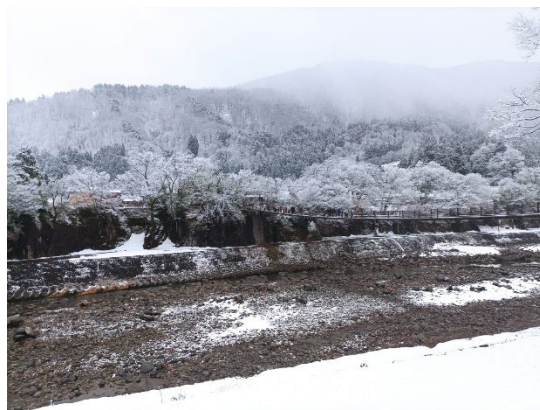
白雪濛濛的白川鄉。