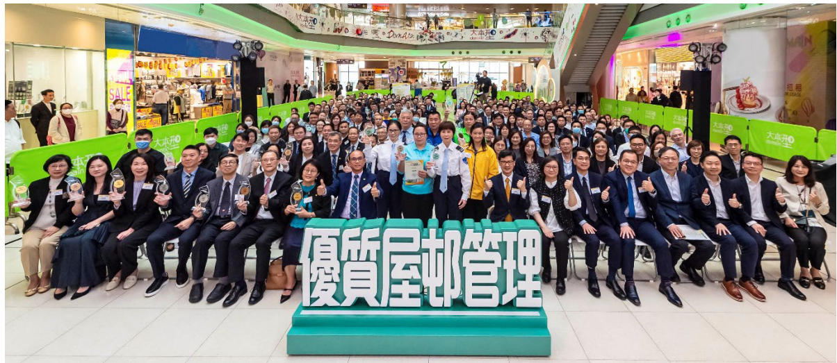
嘉賓與得獎者於頒獎禮上合照。