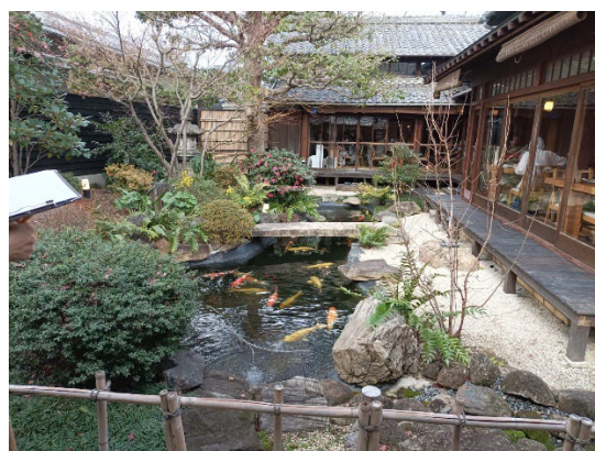
鰻魚食堂內的鯉魚池。