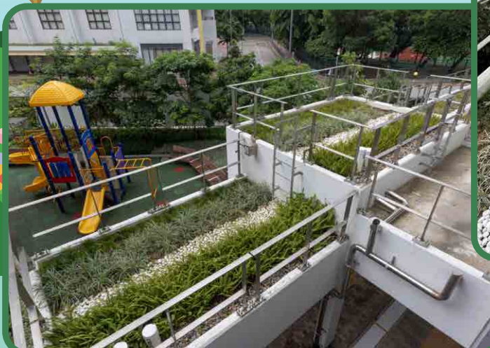
東匯邨匯智樓的屋頂綠化應用了零灌溉系統