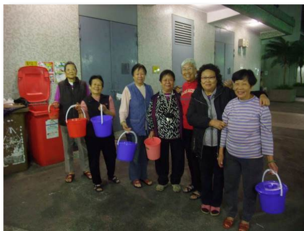
居民把小桶内的厨余倾进住宅大厦旁的大型回收桶