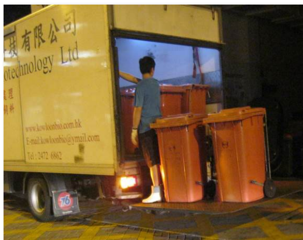
厨余回收商收集厨余并运往邨外转化为鱼粮