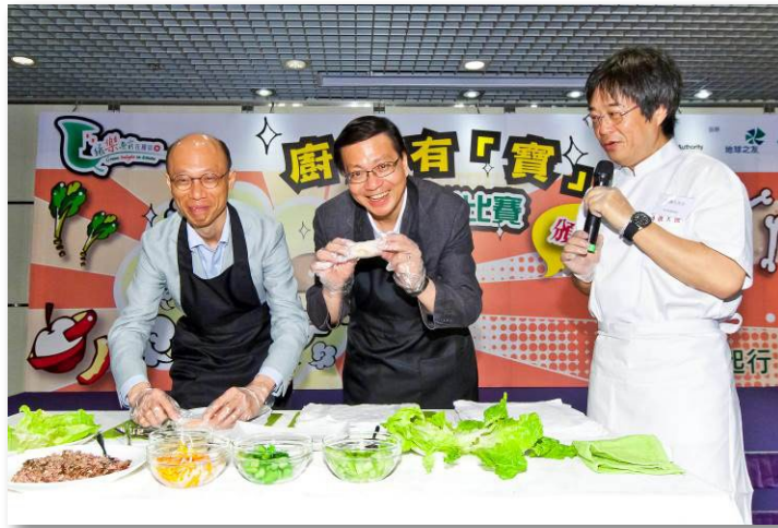
运输及房屋局局长和环保局局长示范如何利用煲汤汤渣制作春卷