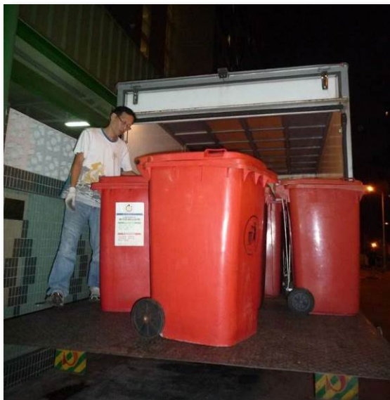
厨余回收商收集厨余到邨外转化再造为鱼粮