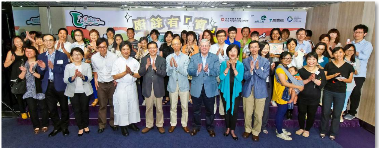
「厨余有『宝』创意食谱比赛」颁奖典礼