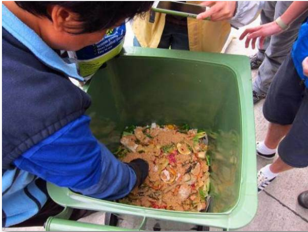
清潔工人在廚餘加入微生物，以助其發酵約2-3星期