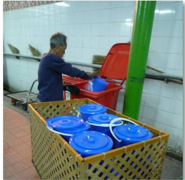
清潔工人將一桶桶的廚餘運往廢物收集站，傾進大型回收桶