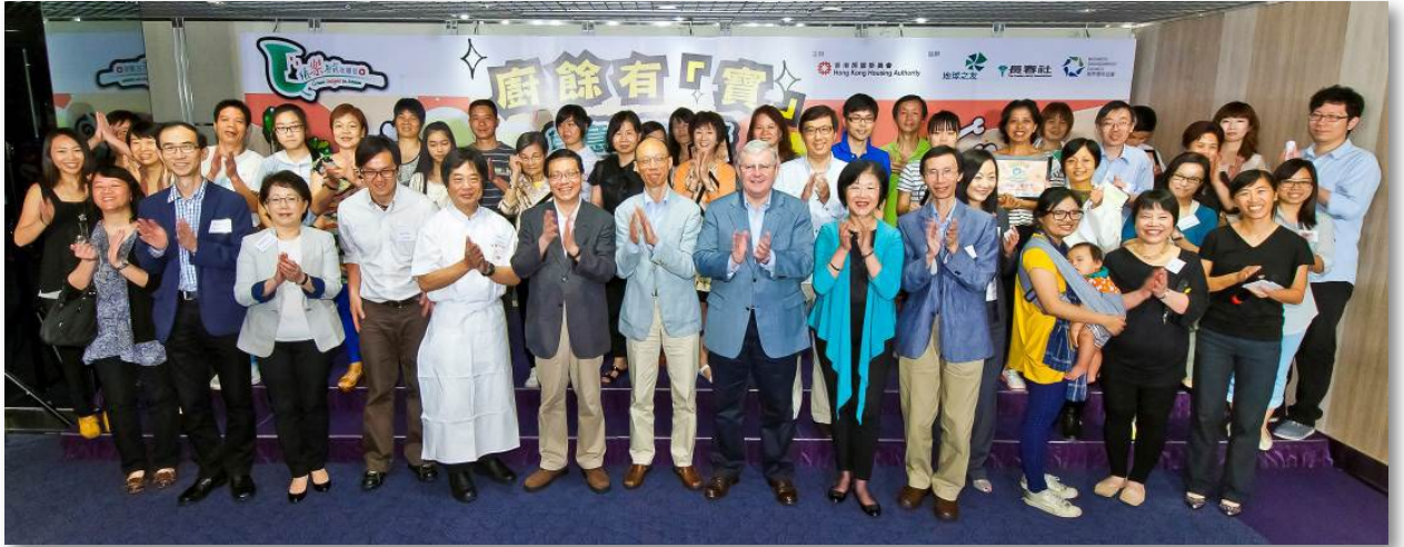
「廚餘有『寶』創意食譜比賽」頒獎典禮