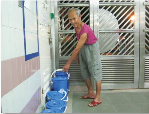
居民將盛載了廚餘的小桶帶到每座大廈地下，並交換清潔的小桶