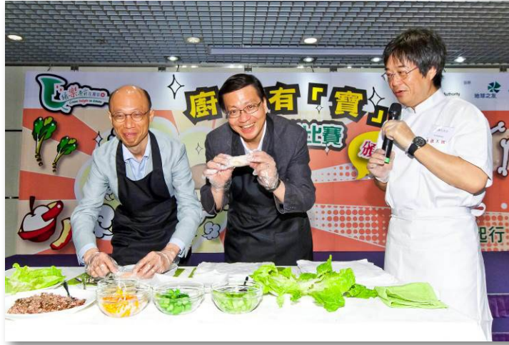
運輸及房屋局局長和環保局局長示範如何利用煲湯湯渣製作春卷