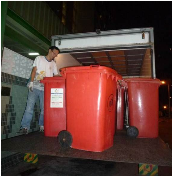
廚餘回收商收集廚餘到邨外轉化再造為魚糧