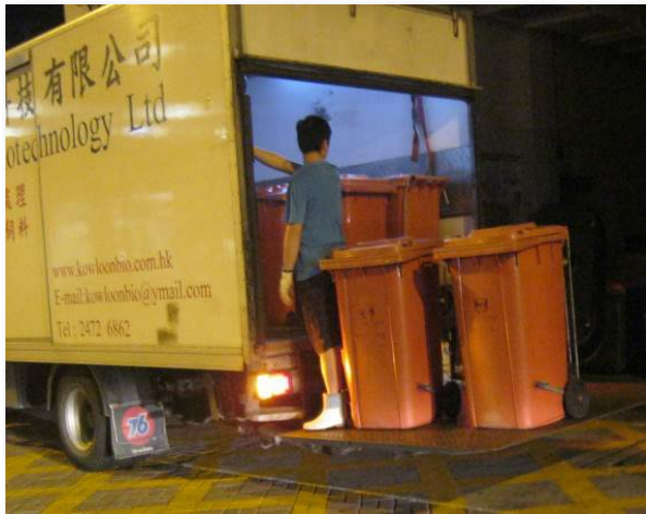
廚餘回收商收集廚餘並運往邨外轉化為魚糧