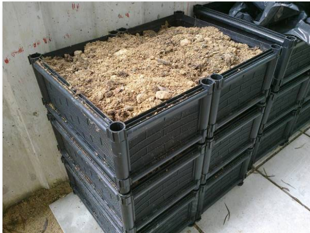
清潔工人挖出埋在泥土下的堆肥，存放供屋邨的社區園圃使用