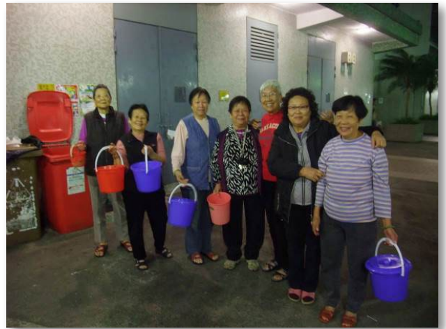
居民把小桶內的廚餘傾進住宅大廈旁的大型回收桶