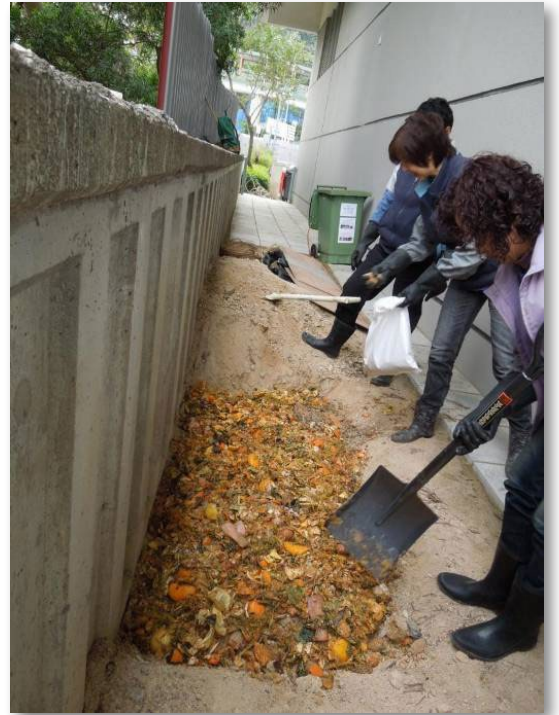
清潔工人在露天空地把已發酵的廚餘埋於泥土一個半月至兩個月以進行堆肥