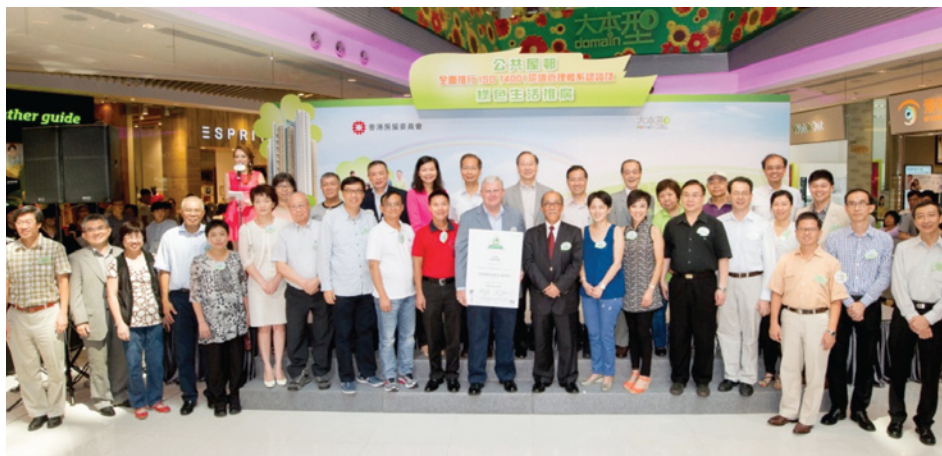
前运输及房屋局常任秘书长(房屋)柏志高先生于2013年8月举行的颁授仪式接受证书

2011年三个试点屋邨成功取得ISO 14001环境管理体系认证后，我们决定分三个阶段扩展计划，最终将全港其余155个屋邨的物业管理服务纳入认证范围。全赖前线人员和总部职员同心协力，2013年7月所有屋邨均通过ISO 14001认证，表扬我们竭力推行良好作业方式和不断提升环境管理水平。