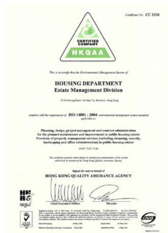
屋邨管理处的ISO 14001证书