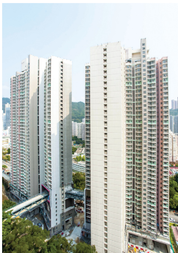
葵聯邨葵逸樓和葵悅樓