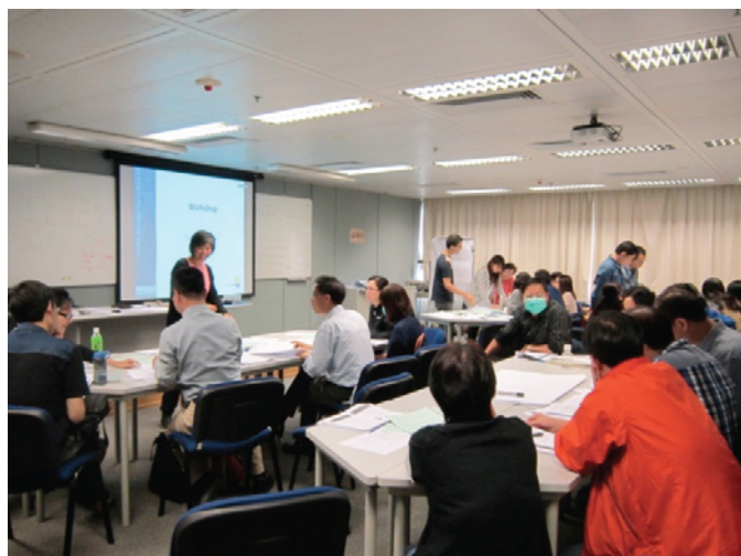
內部審核員培訓工作坊