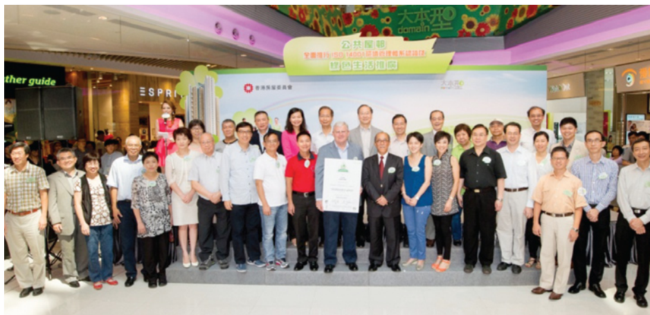
前運輸及房屋局常任秘書長(房屋)栢志高先生於2013年8月舉行的頒授儀式接受證書

2011年三個試點屋邨成功取得ISO 14001環境管理體系認證後，我們決定分三階段擴展計劃，最終將全港其餘155個屋邨的物業管理服務納入認證範圍。全賴前線人員和總部職員同心協力，2013年7月所有屋邨均通過ISO 14001認證，表揚我們竭力推行良好作業方式和不斷提升環境管理水平。