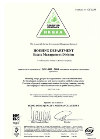
屋邨管理處的ISO 14001證書