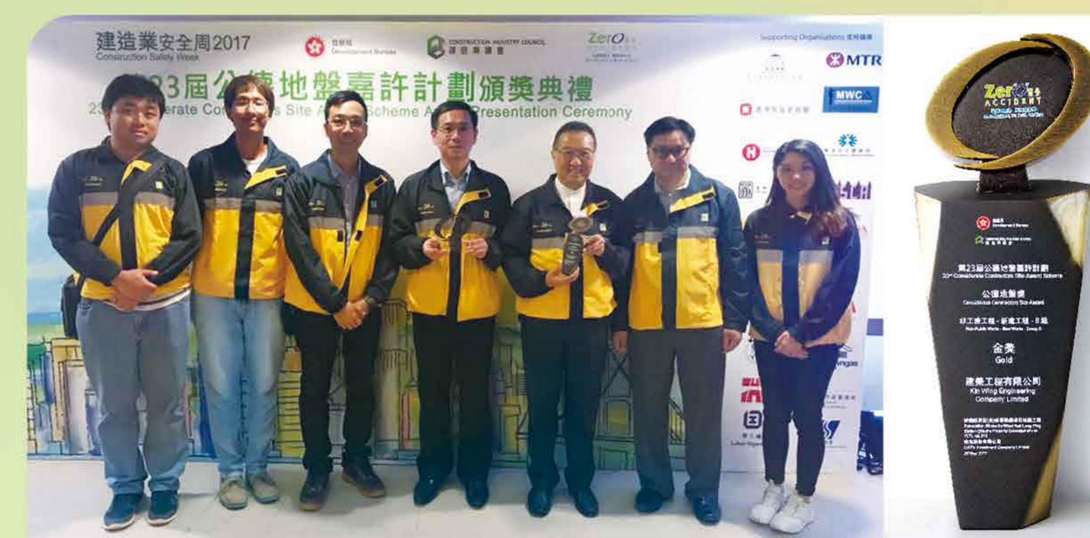
今年九月獲得第二十三屆「公德地盤嘉許計劃」非工務工程——金獎