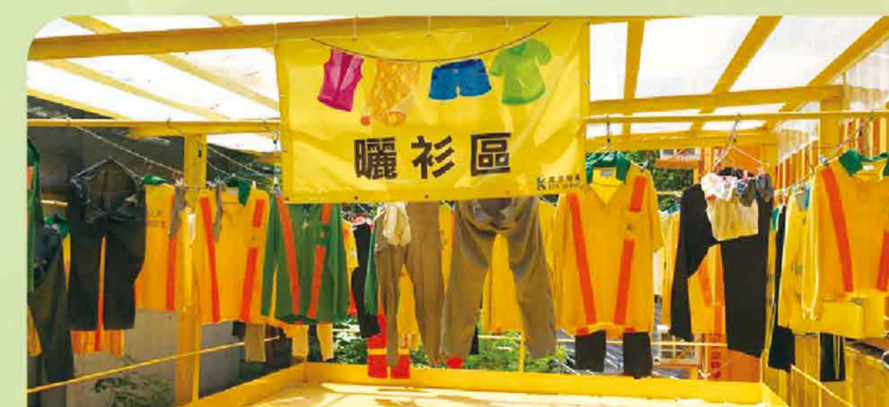
提供整潔的曬衫區