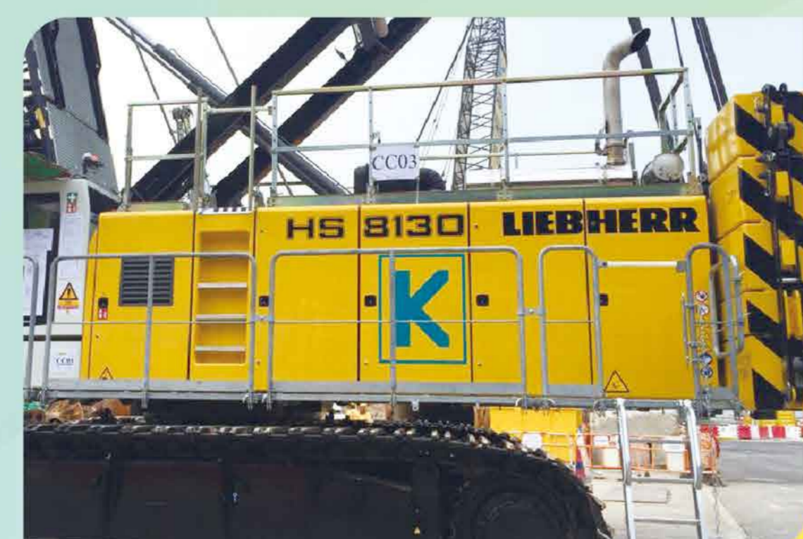
新型吊機採用環保柴油車用尿素有助減低氮氧化物排放