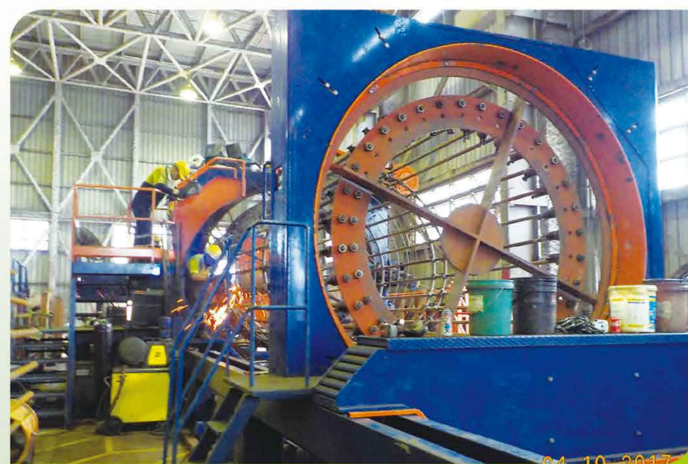
大口徑樁鋼筋籠機械化