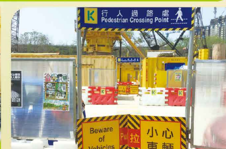
提供安全出入通道