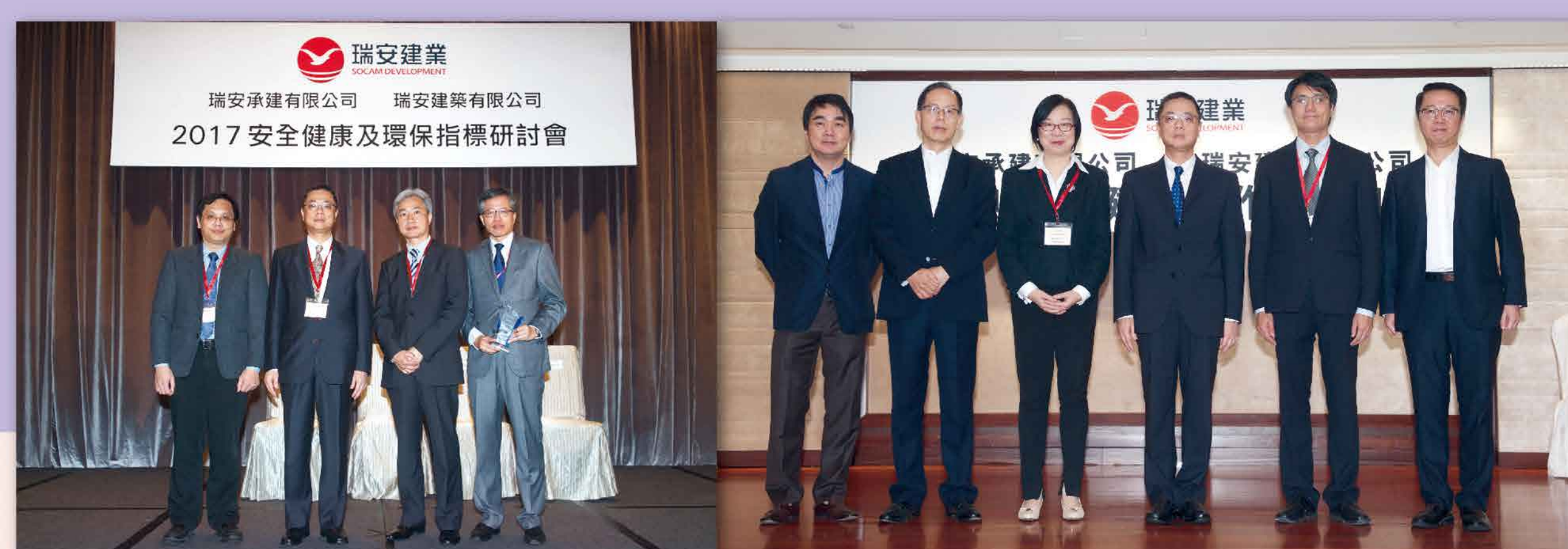
2017年度安全健康及環保指標研討會