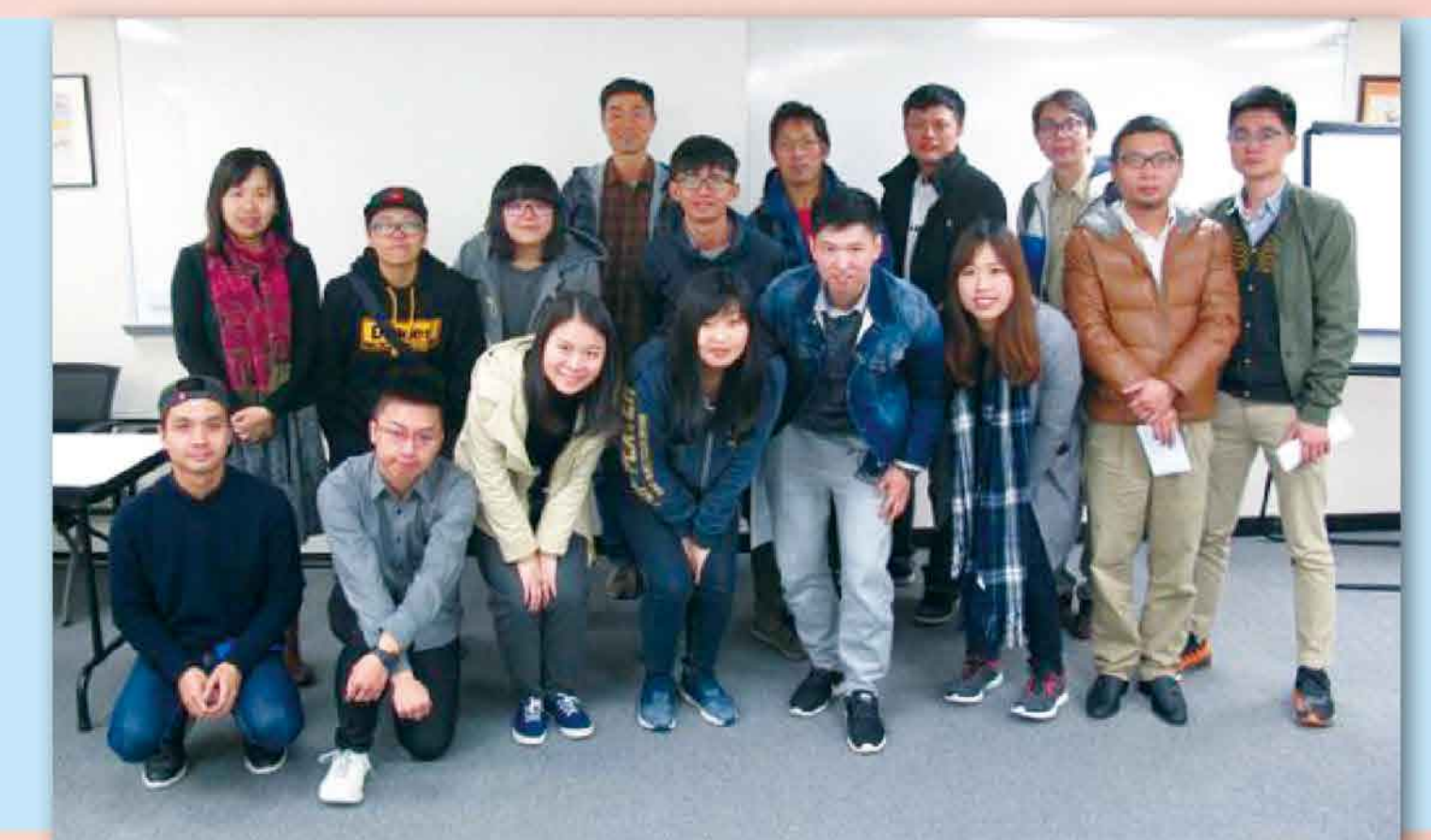
2016承判商安健環工作坊