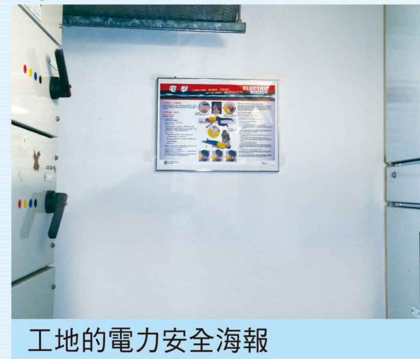
工地的電力安全海報