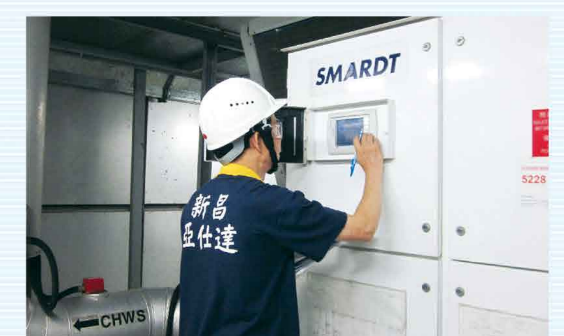
定期檢查中央冷氣及調教數據