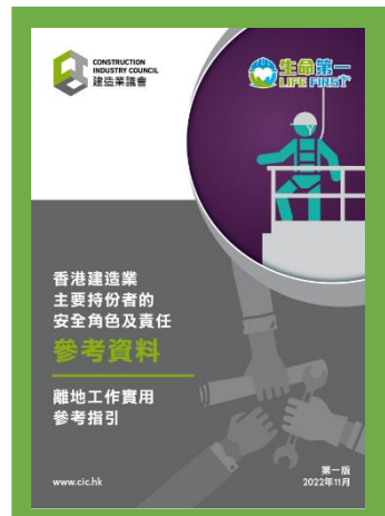
參考資料 - 香港建造業主要持份者的安全角色及責任 (離地工作實用參考指引)