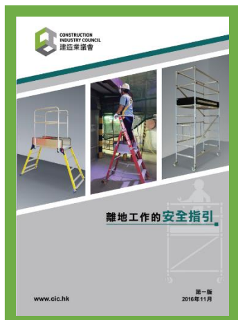
離地工作的安全指引