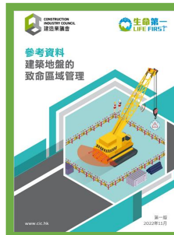
參考資料 - 建築地盤的致命區域管理