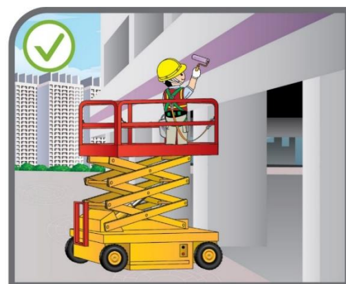
使用合適的工作平台，例如： 動力操作升降工作台或流動工作台