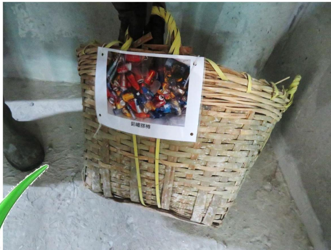
Photo was used to indicate the purpose of container.