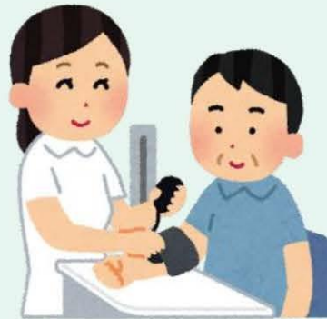
鼓勵員工參與 健康風險評估