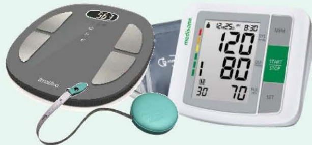
購買健康評估儀器套裝