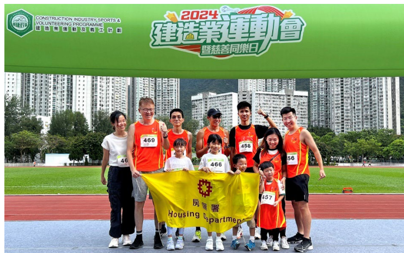
房屋署参赛同事及家人于「建造业运动会暨慈善同乐日 2024」活动合照。