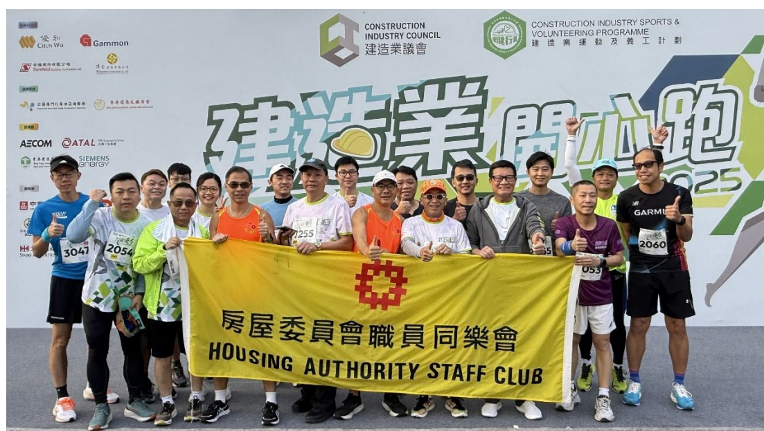
参赛同事于「建造业开心跑 2025」活动后来个大合照。