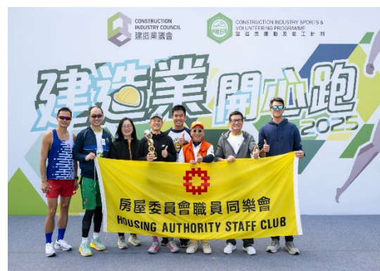
房屋署团队夺得「建造业最坚毅企业奖」亚军。