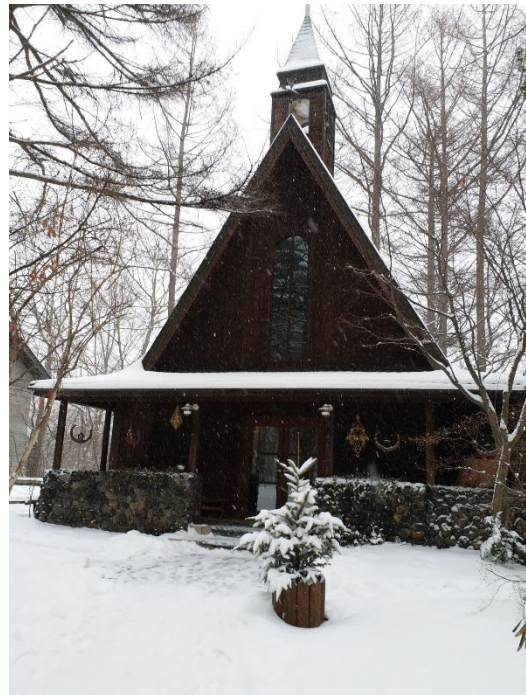
高原教会木造教堂。