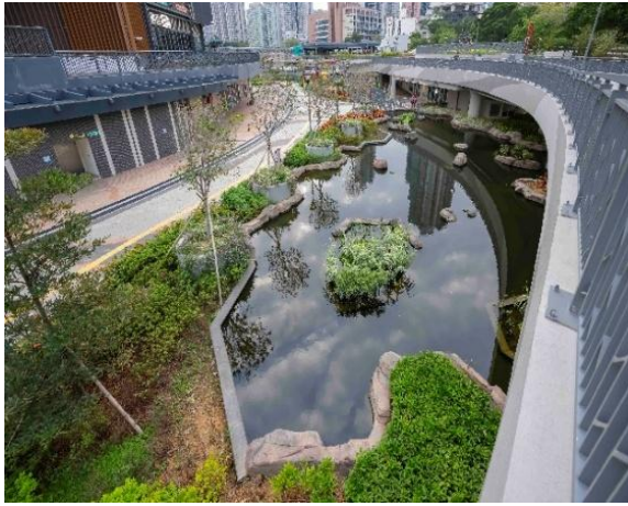
活水沿途滋养河道的水生植物。

「活水」经污水处理厂过滤，引入公园河道，再排出启德河，沿途滋养河道的多种水生植物；自然生态的设计传递生态保育、持续发展的理念。