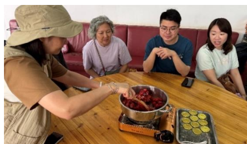
同事体验草莓果酱制作。

当日大队上午抵达上水富琴火龙果有机农庄,展开充实的农耕体验;参观有机菜田、火龙果园、木瓜园、钓鱼场等特色区域;并参加工作坊,在专业农夫指导下,亲自制作草莓果酱;中午于农庄品尝地道的农家有机餐。