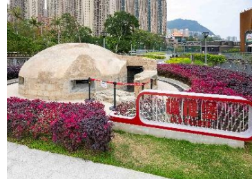
「大磡村三宝」——（左起）前皇家空军飞机库、石寓、机枪堡。

公园设有标志着香港电影黄金岁月的李小龙径和相关艺术装置，电影元素更融入部分游乐设施，传承本土文化。