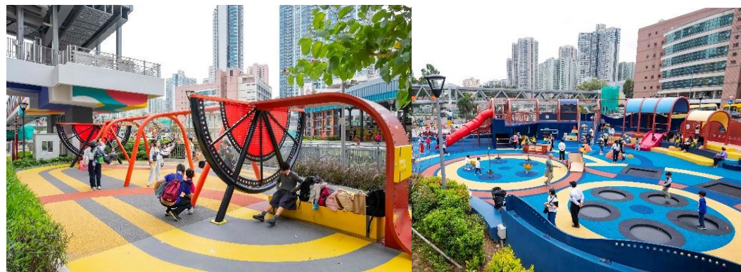
游乐设施引入电影元素（左）；游乐设施丰富，设计创新。