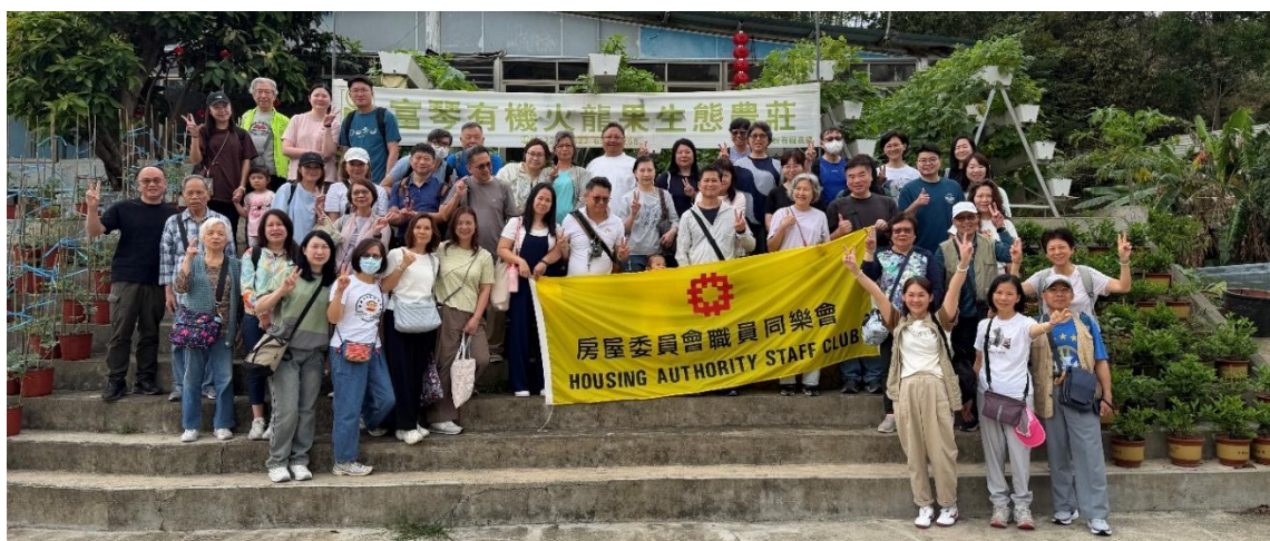
一众参加者在有机农庄前合照。

同乐会4月11日举办「慈山寺、上水富琴火龙果有机农庄一天游」。活动报名反应热烈,吸引逾40名同事及亲友参加。