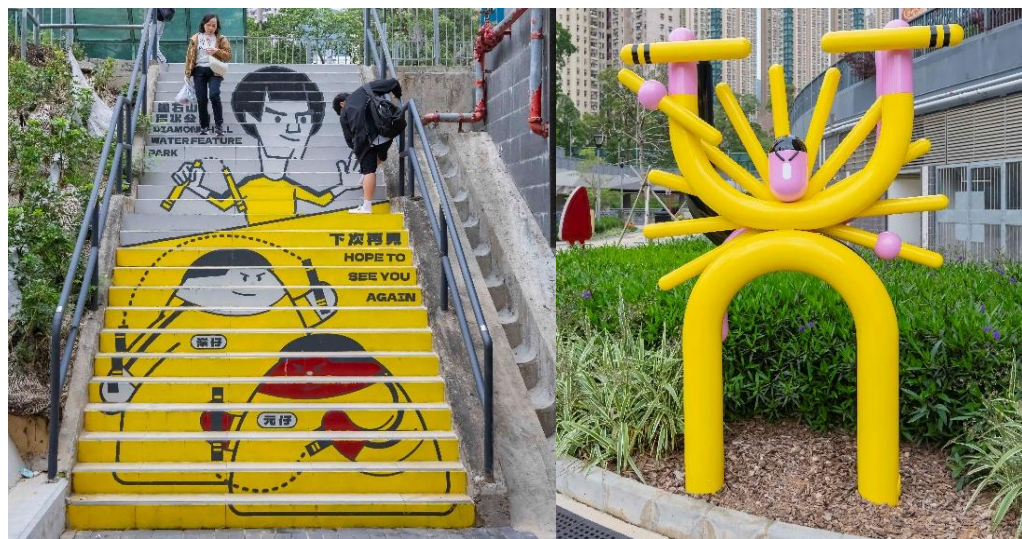
李小龙径（左）和相关的艺术装置。