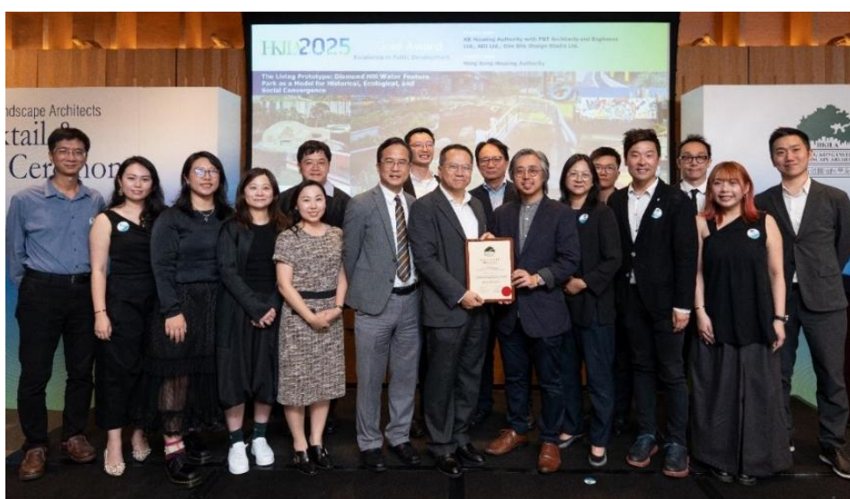
设计和兴建公园的团队获颁金奖。

香港房屋委员会（房委会）设计和兴建的钻石山活水公园荣获「香港园境师学会 2025 年奖 — 卓越公共发展项目」金奖，表扬房委会在提升小区生活质素和幸福感方面作出的努力。