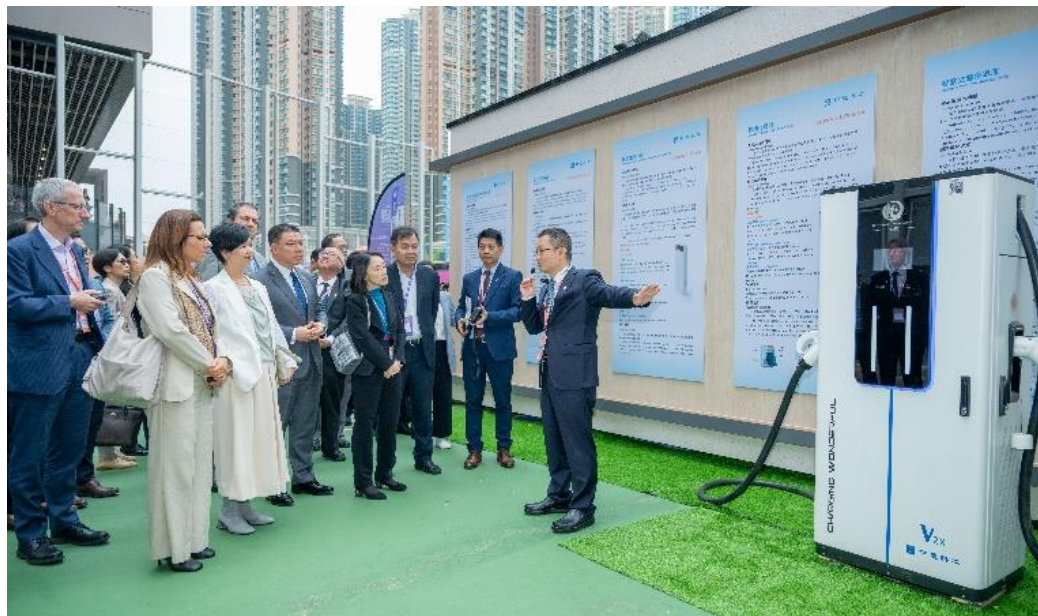
局长与海外嘉宾参观「好房子移动展示房」。

随后，局长与嘉宾参观「好房子移动展示房」，展览由中华人民共和国住房和城乡建设部（住建部）科技与产业化发展中心举办，旨在启发全球公私营房屋探索未来居所的新可能。