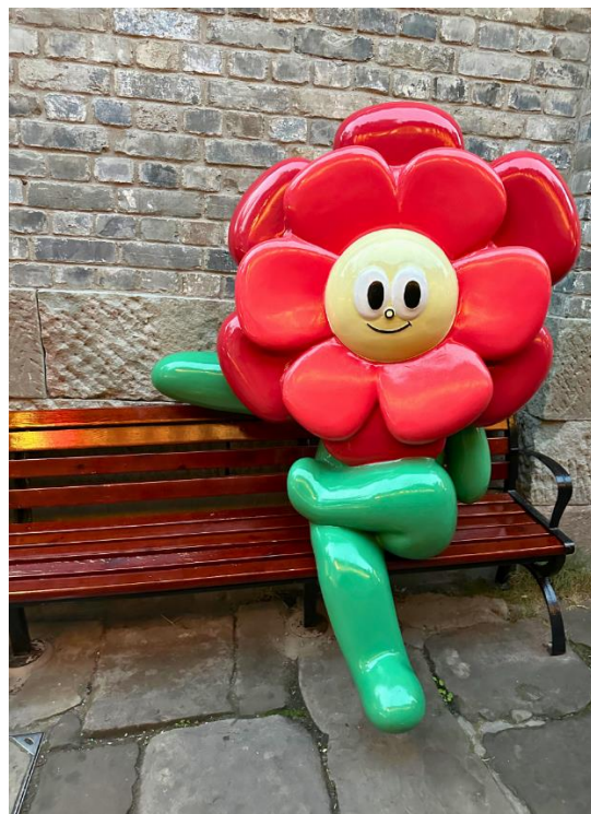
重庆磁器口文创街的展品。