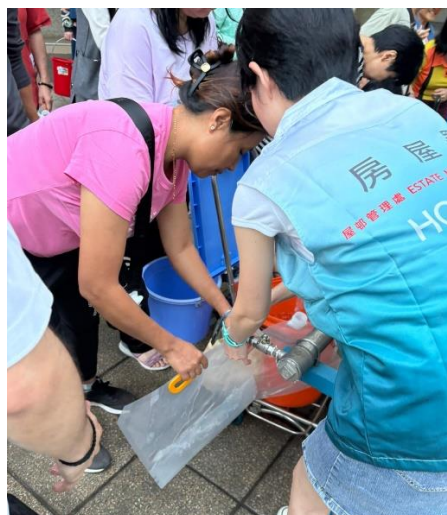
团队在供水点协助居民盛水和维持秩序。

天平邨因邻近地区食水管爆裂而停水，为居民带来不便，尤其影响当时正在准备冬至团聚饭的长者家庭。得悉情况后，团队迅速行动，与水务署、地区关爱队和法团的管理公司紧密合作，启动应急措施，安排临时供水车到达现场，并主动上门为行动不便的长者家庭送水，确保居民获得所需用水。