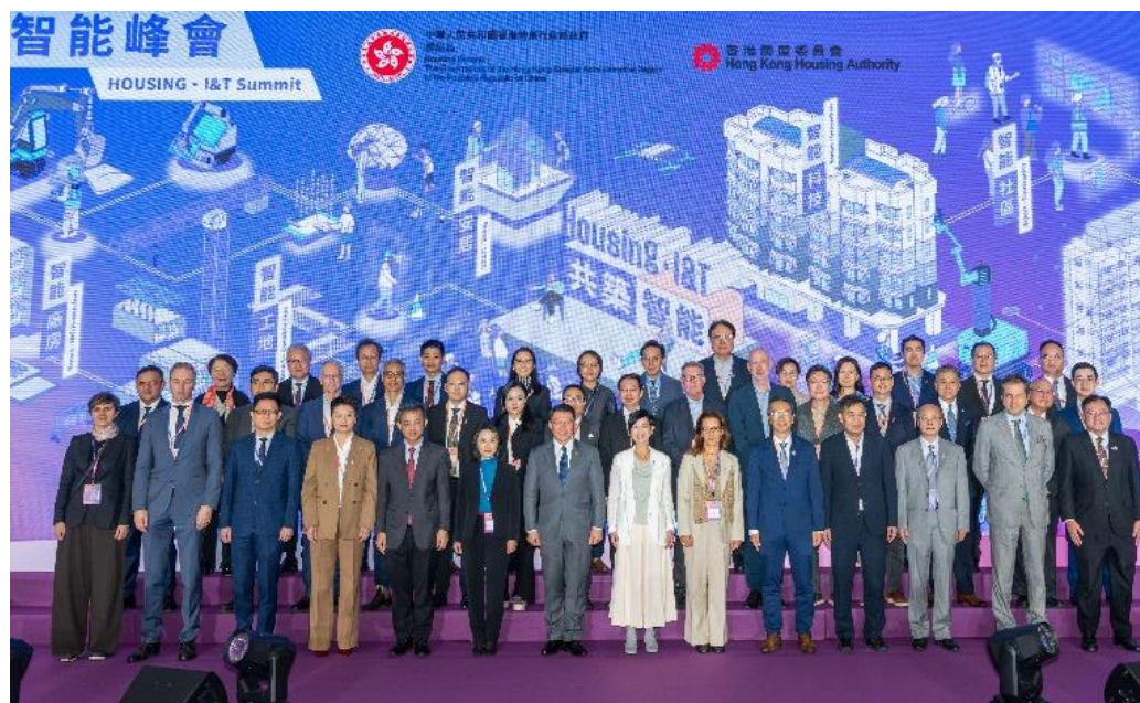
房屋局局长何永贤（前排右七）和房屋局常任秘书长及房屋署署长李佩诗（前排右九），与嘉宾在峰会开幕礼合照。

房屋局与香港房屋委员会（房委会）合办「共筑·智能峰会」，为香港房屋建设的未来发展注入新思维，加快为市民建构更优质居所。为期四天的峰会在 2025 年 11 月 4 日至 7 日举行，以「智能助建屋 共筑展未来」为主题，邀请全球超过 15 个国家和城市的 400 多位公共房屋领域专家、学者和业界领袖参与。峰会提供一个宝贵平台，促进跨地域技术交流，共同寻求房屋问题的解决方案。