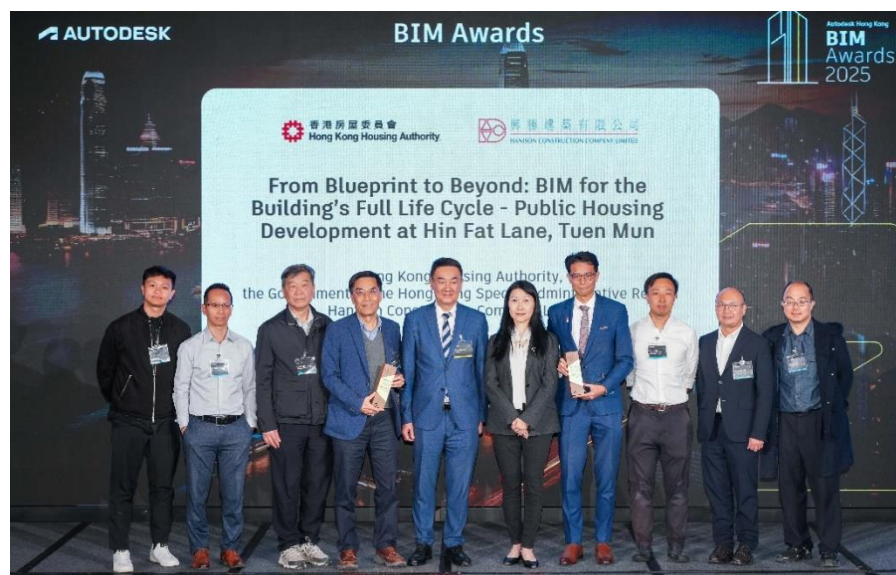
得奖项目团队、总承包商与主礼嘉宾合照。

房委会屯门显发邨公营房屋发展项目获 Autodesk 颁发「建筑信息模拟设计大奖 2025」，肯定房委会于建筑信息模拟 (BIM) 技术应用上的成绩。