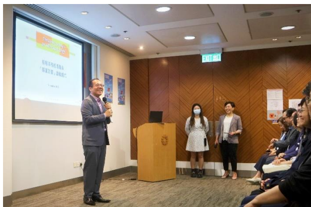
康荣杰分享他在屋邨管理处的宝贵经验。

启动仪式11月17日举行。房屋署副署长（屋邨管理）康荣杰分享他在屋邨管理处的宝贵经验。他勉励学员努力学习，与导师交流，吸收新知识，迎接未来挑战。随后他向各导师颁授委任状，鼓励他们肩负职系知识承传的使命。