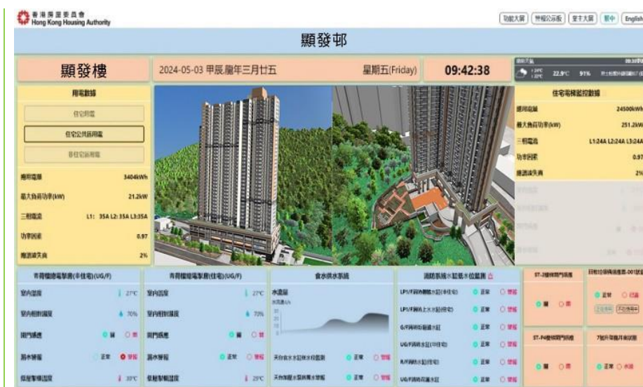
显发邨的 BIM 技术应用。

显发邨是首批整合 BIM 与地理信息系统，建立统一数据平台的项目，更透过物联网传感器监测太阳能板、电动车充电设施和水务系统，推动低碳营运与可持续发展。