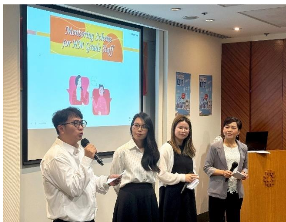
前学员分享「导师计划」的得着。

此外，培训中心人力资源发展组运用手机应用程序，了解各导师和学员对「导师计划」的感受和期望，促进大家互动交流；前学员更分享「导师计划」的体验。导师的指导和经验分享增加学员知识，扩阔视野，并提升处事能力和信心。