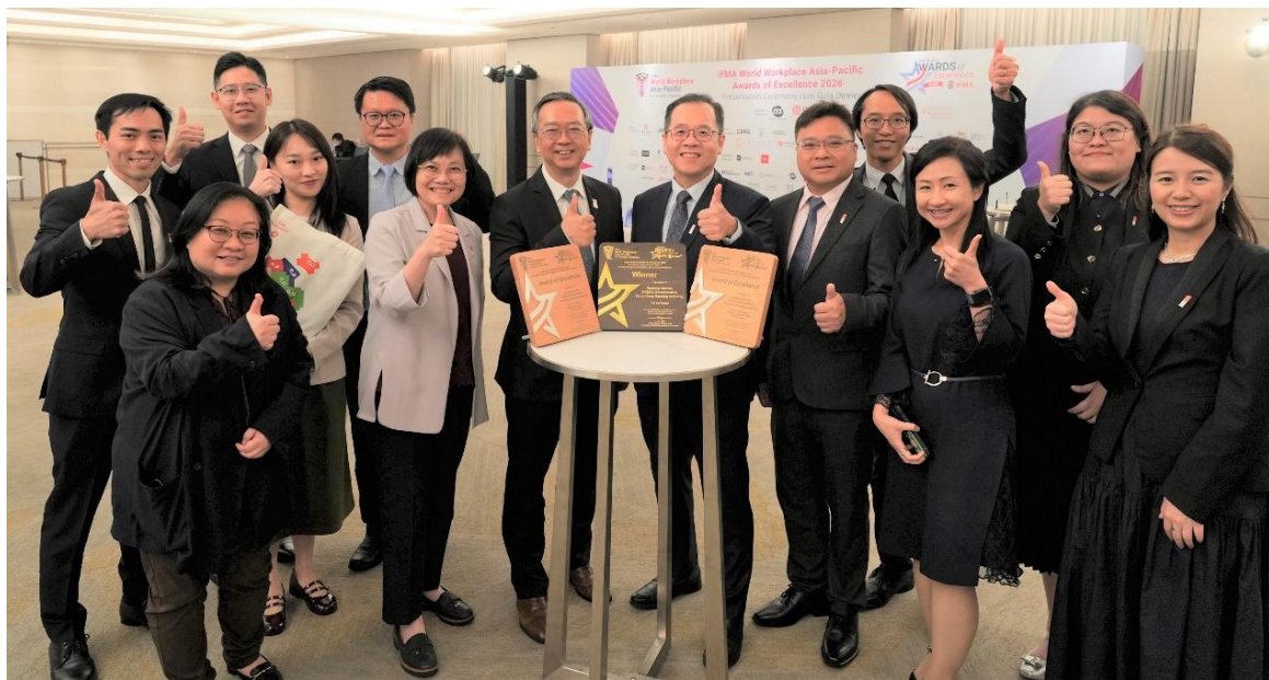
房屋局副局長戴尚誠（前排左三）與啟業邨項目管理團隊合照。

啟業邨項目以「日出主題」設計，全面重塑邨內公用空間，包括走廊活化為「社區生活走廊」、籃球場改造成多用途跨代共享空間等，提升設施管理的營運效率，增強居民的社區歸屬感。