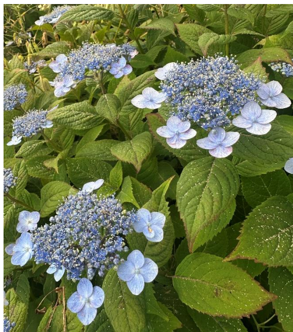
濟州的平頂繡球花盛開。