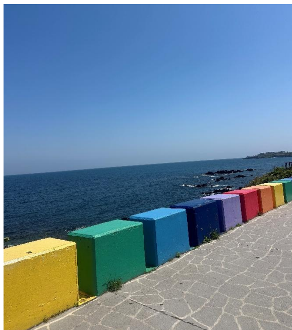
道頭洞彩虹海岸道路。