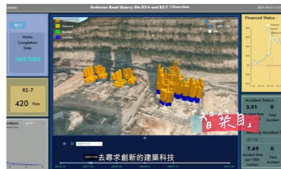
「智築目」是房委會項目資訊管理及分析平台。

房委會與多家科研機構和大學合作，不繼推動建築和屋邨管理的科技發展和應用，以更安全、更快捷的方式增加房屋供應；同時善用無人機檢測、物聯網、人工智能監察系統等科技發展。