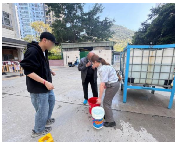
團隊協助居民運送食水。