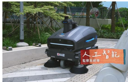
人工智能監察系統提升屋邨保安效率。