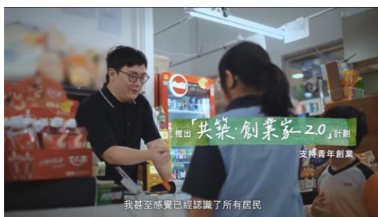
「共築·創業家」為社區注入新的活力和生氣，豐富居民的購物體驗。

從公營房屋的設計到社區建設，房委會着力為市民締造幸福的生活環境。近年推出「幸福設計」指引，改善屋邨環境、公共空間和設施的設計和應用，從生活各個細節提升居民的幸福感。「共築·創業家」計劃支持青年實踐創業夢想，為旗下特定商舖創業的35歲或以下參加者，提供免租優惠，以試行創業方案，藉此鼓勵青年上進上流。