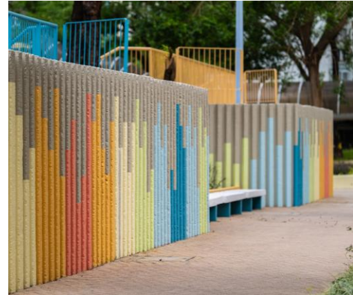
「日出主題」設計在邨內公用空間呈現。

項目團隊秉持以人為本的理念，在重塑工程前深入了解啟業邨居民的日常習慣和實際需要，透過整合資源、改善管理流程和促進跨專業協作，落實高效項目管理。啟業邨團隊也積極推動社區參與，安排互動問卷、共創工作坊、嘉年華等活動，讓各持份者成為設計伙伴，一同締造共融的社區空間，體現社區共創的價值。