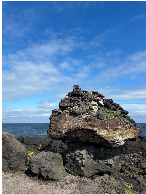
黑火山岩與許願石塔。

〈閒情寄趣〉一欄歡迎各同事與大家分享其攝影、書法、繪畫、雕塑、陶瓷、篆刻、紙藝或其他視覺藝術作品、手工藝品等，以展現生活情趣為宗旨。作品以照片形式發放，來稿詳情如下：