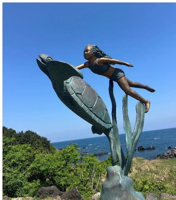
路旁的海女與海龜雕像。