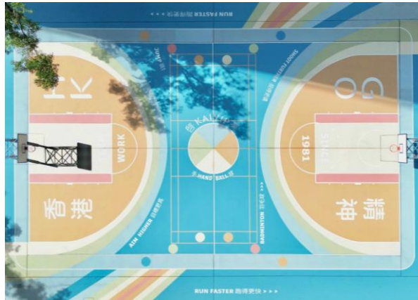
啟業邨籃球場改造為多用途球場。