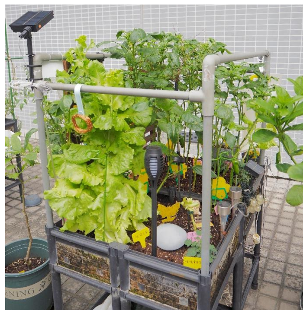
冠軍和環保創意獎 — 隋園 (生菜、蕃茄、三色椒)。