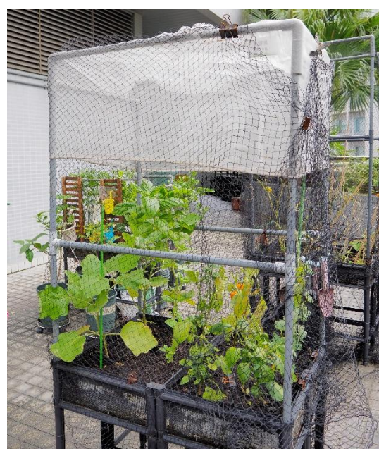
季軍 — 百籽貴 (三色椒、羅勒)。