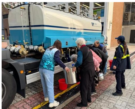
團隊在供水點協助居民盛水。