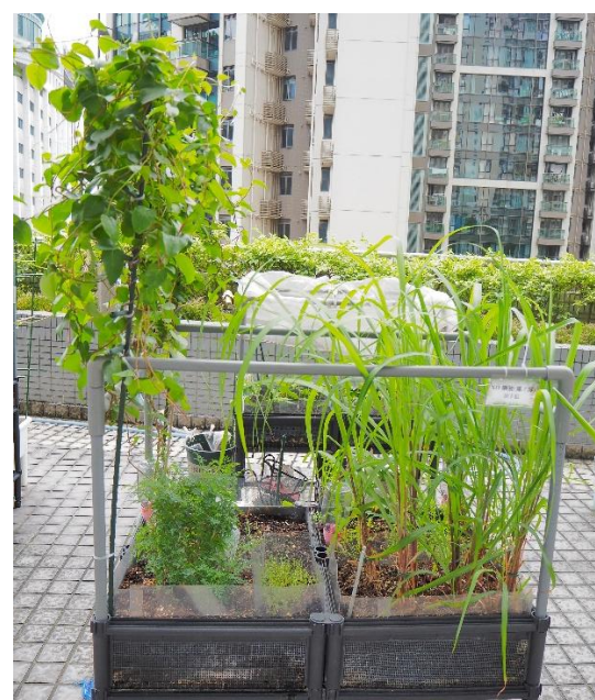
亞軍 — XO 樂園 (香茅、臭草、落葵薯、紅蘿白)。