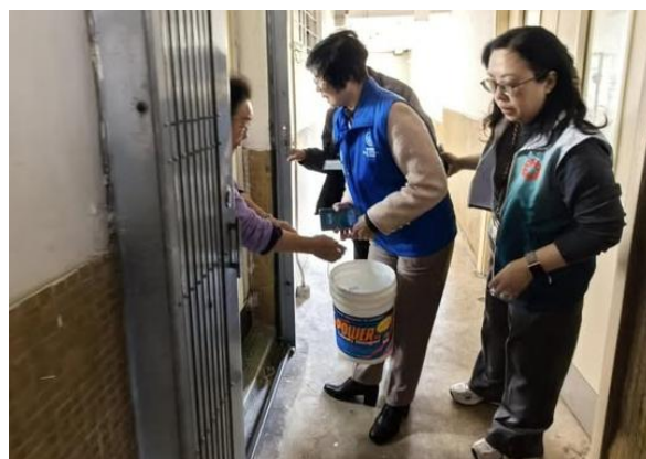
團隊為有需要住戶提供食水。

團隊對是次嘉許深感鼓舞，將繼續堅守崗位，與社區持份者加強溝通，確保迅速回應緊急事故，並秉持「創新為民、盡責熱誠」的精神，為社區提供可靠的支援與服務。