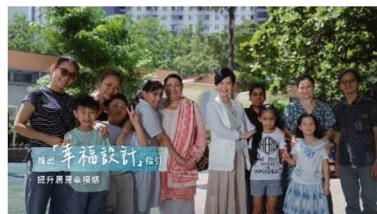
「幸福設計」指引用作興建新公營房和翻新現有屋邨工程的參考。

最新機構短片已上載至 房委會 / 房屋署網站 、 房委會 Facebook 專頁 和 YouTube 頻道 ，供公眾觀看。