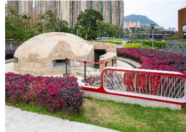
「大磡村三寶」——（左起）前皇家空軍飛機庫、石寓、機槍堡。

公園設有標誌着香港電影黃金歲月的李小龍徑和相關藝術裝置，電影元素更融入部分遊樂設施，傳承本土文化。