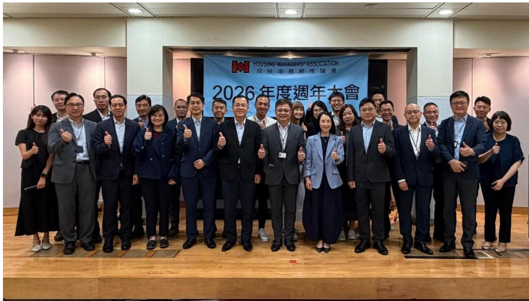
署長李佩詩（前排右五）、副署長（屋邨管理）康榮傑（前排左六）、房屋事務經理協會主席蕭孝聰（前排右六）與理事會成員合照。

房屋事務經理協會第 56 屆周年大會 4 月 30 日舉行，房屋署署長李佩詩、副署長（屋邨管理）康榮傑等多名首長級人員應邀出席。