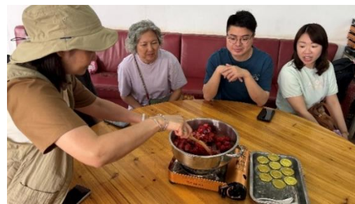
同事體驗草莓果醬製作。

當日大隊上午抵達上水富琴火龍果有機農莊，展開充實的農耕體驗；參觀有機菜田、火龍果園、木瓜園、釣魚場等特色區域；並參加工作坊，在專業農夫指導下，親自製作草莓果醬；中午於農莊品嚐地道的農家有機餐。