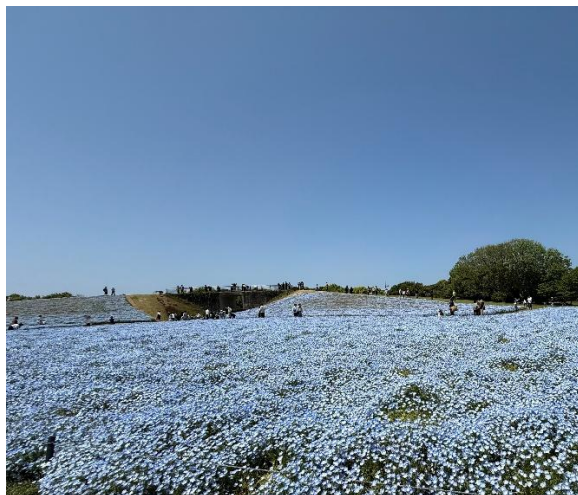
海之中道海濱公園的藍色花海。