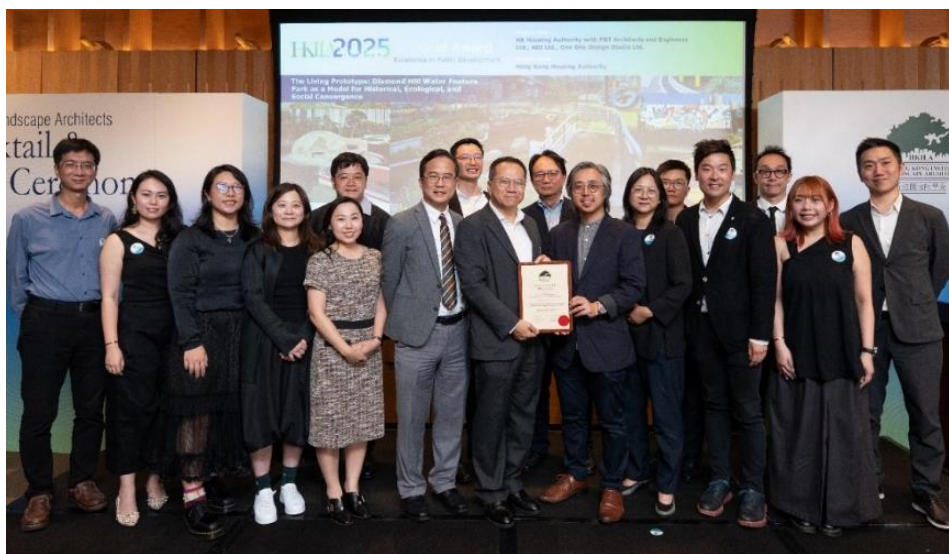
設計和興建公園的團隊獲頒金獎。

香港房屋委員會（房委會）設計和興建的鑽石山活水公園榮獲「香港園境師學會 2025 年獎 — 卓越公共發展項目」金獎，表揚房委會在提升社區生活質素和幸福感受方面作出的努力。