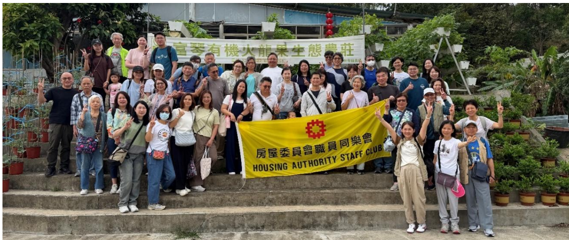
一眾參加者在有機農莊前合照。

同樂會 4 月 11 日舉辦「慈山寺、上水富琴火龍果有機農莊一天遊」。活動報名反應熱烈，吸引逾 40 名同事及親友參加。