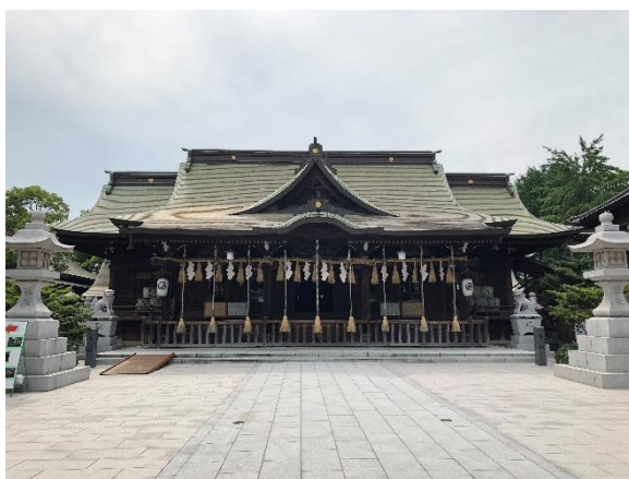
小倉城內的八坂神社。