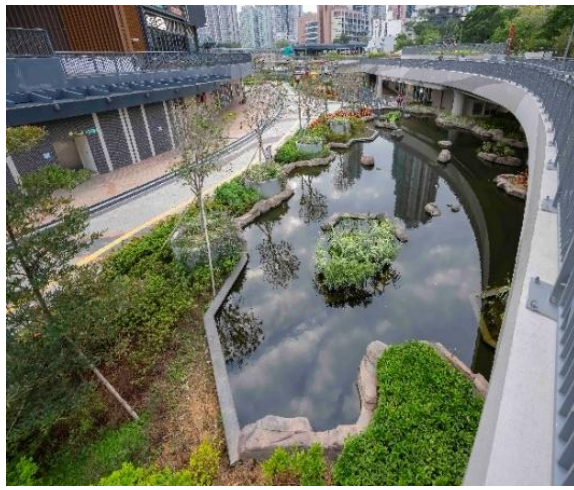
活水沿途滋養河道的水生植物。

「活水」經污水處理廠過濾，引入公園河道，再排出啟德河，沿途滋養河道的多種水生植物；自然生態的設計傳遞生態保育、持續發展的理念。