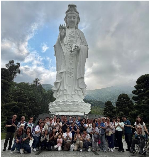
一眾參加者於觀音像前合照。

午飯後，大隊前往大埔洞梓慈山寺參觀。寺內環境寧靜祥和，四周山巒環抱，屹立其中的觀音像高達 76 米，是全球第二高的戶外青銅合金觀音像；眾人讚嘆不已。全日行程豐富充實，大家盡興而歸。