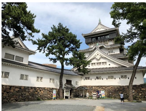
建於江戶時代的小倉城。