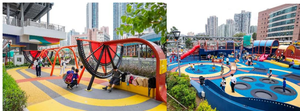
遊樂設施引入電影元素（左）；遊樂設施豐富，設計創新。