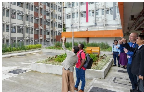
參加者到牛頭角彩興路簡約公屋項目實地考察。

峰會最後安排參觀啟德世運道和牛頭角彩興路的簡約公屋項目，與會者讚賞簡約公屋簡潔、舒適的設計，我們與來自澳洲和日本的學者展開交流，共同探討建築科技的未來發展方向。